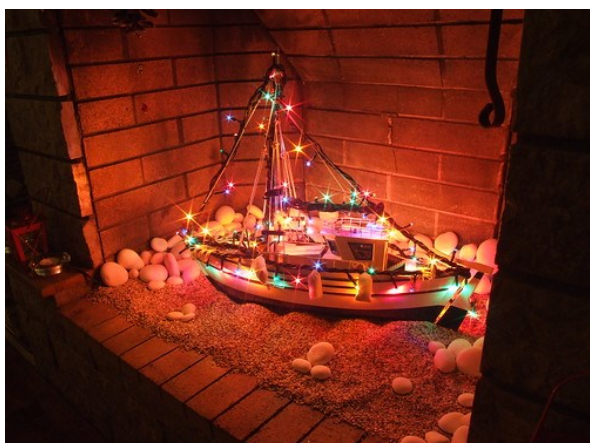
On les retrouve aussi bien dans les maisons ...

Dans ce pays, ce ne sont pas les sapins qui sont mis à l'honneur pendant les fêtes de fin d'année mais les bateaux ! Cette tradition est en l'honneur des marins pêcheurs qui partaient de longs mois en mer.