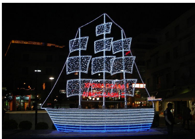
... que sur les grandes places des villes ...