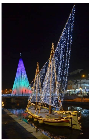
... ou même dans les ports !