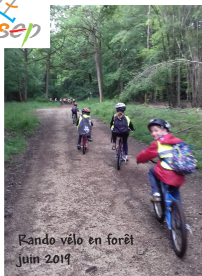
Rando vélo en forêt juin 2019