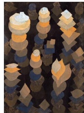
Paul Klee, Growth of the night plants