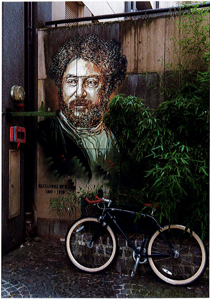
Alexandre Dumas, grand écrivain du 19 e siècle, s'est installé rue Malebranche.