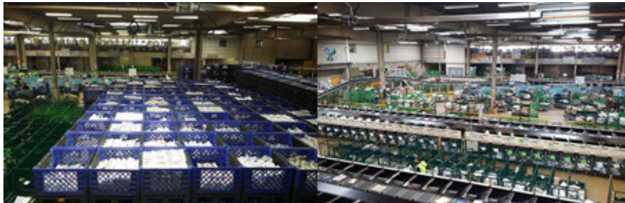
Viapost à Chilly-Mazarin

Le Groupe la Poste et sa filiale Viapost, fidèles depuis 17 ans, assurent la logistique pour la confection des colis et leurs distributions dans les établissements scolaires. Cette année, les équipes du site de Chilly-Mazarin (Viaspost) seront à pieds d'œuvre pour constituer et envoyer près de 43 000 colis-presse.