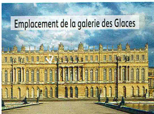
Emplacement de la galerie des Glaces