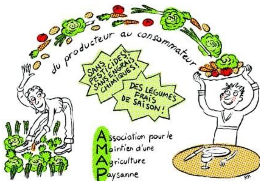
Document 1. L'agriculture locale

Après avoir regardé ces documents, complète le tableau suivant :