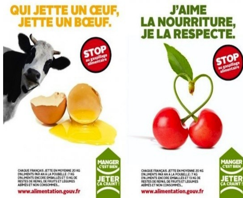
Document 4. Une campagne contre le gaspillage alimentaire