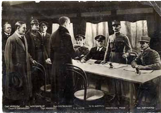
Le wagon de l'Armistice, forêt de Compiègne, Le 11 novembre 1918

La signature de ..... l'Armistice ..... mettant fin à la Première Guerre Mondiale, le 11 novembre 1918.