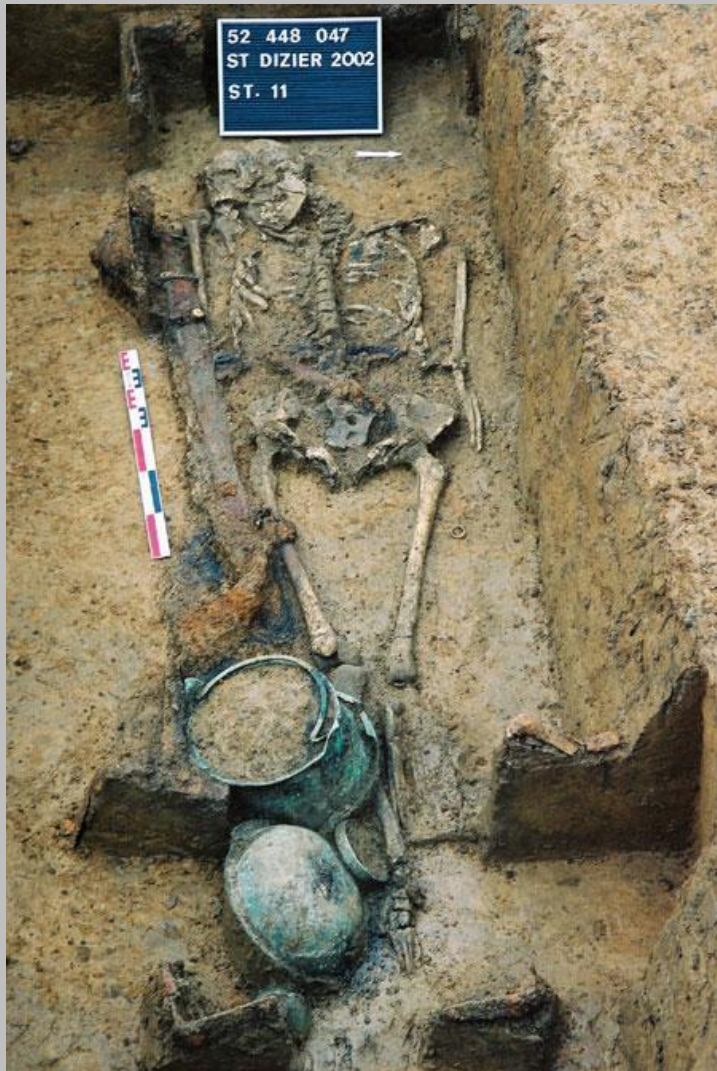
Doc.1 :Tombe mérovingienne, VI e siècle