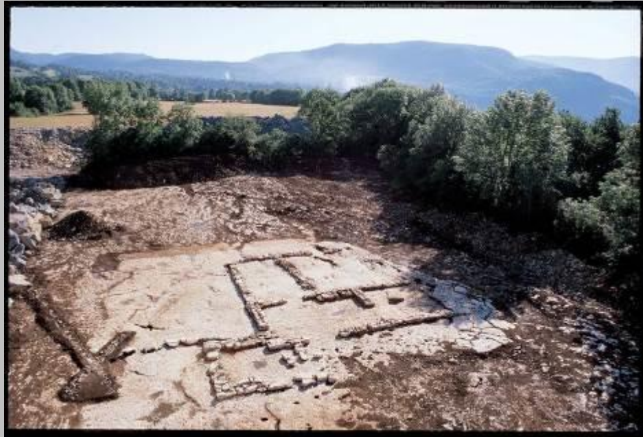
Doc. 4 : Restes d'un bâtiment résidentiel de l'époque mérovingienne, VII e siècle Mis à jour lors de fouilles à Pratz (Jura), 2000.