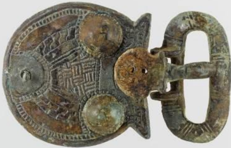
Doc. 3 : Boucle de ceinture, V e siècle Retrouvée dans la nécropole de Sainte- Fontaine. MUDO. Musée de l'Oise, Beauvais.