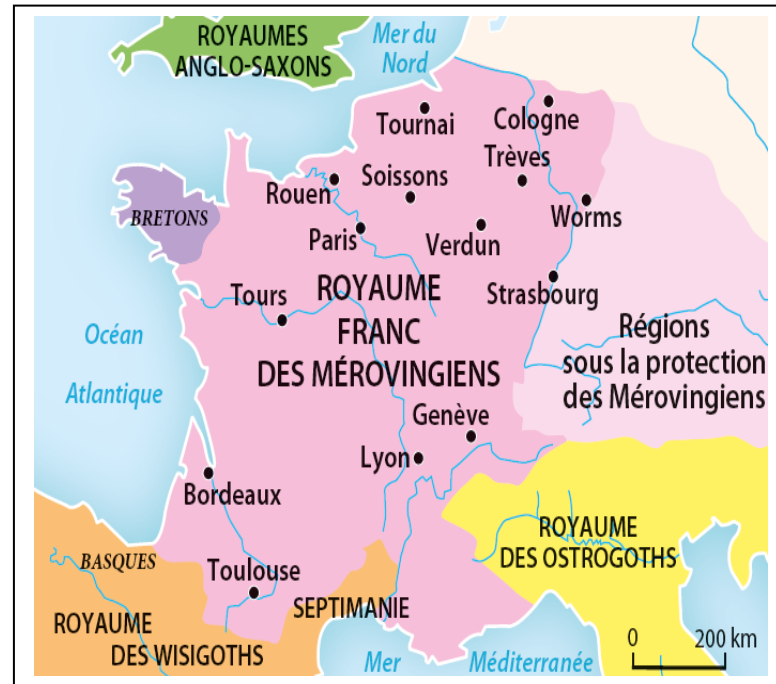
Doc. 6 : Carte de l’implantation des Mérovingiens au VI e siècle