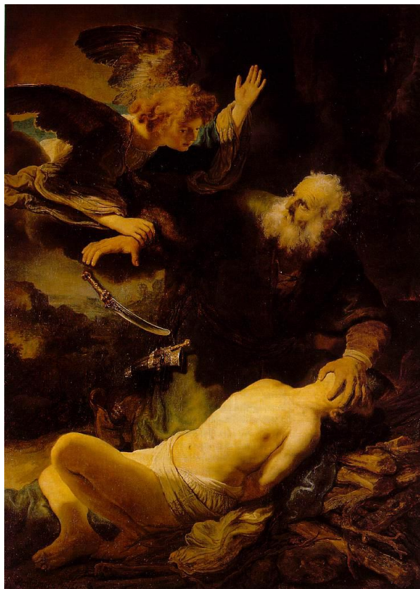
Rembrandt (1630) le Sacrifice d'Isaac

La liste de ces questions pourrait être longue, l'important n'est pas forcément d'y répondre mais d'en parler, d'échanger et de chercher à toujours à mieux comprendre celui qui ne pense pas exactement comme nous.