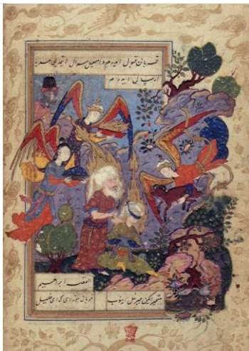
Miniature d'un Coran du XVe s Représentant le sacrifice d'Ismaël

Pour éprouver la fidélité d'Abraham, Dieu lui demande de lui donner son fils en sacrifice. Dans la Torah et dans la Bible , on parle du sacrifice d'Isaac, alors que dans le Coran , on parle du sacrifice d'Ismaël.