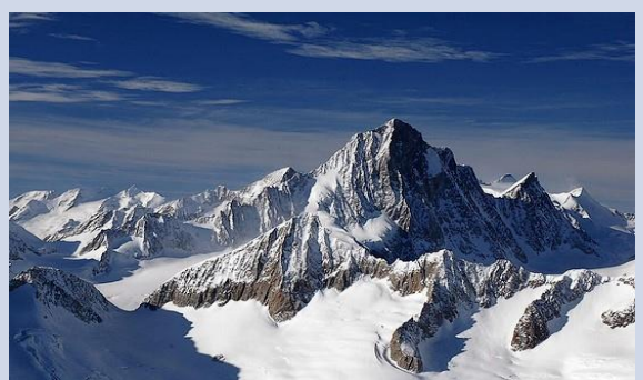
Massif des Alpes