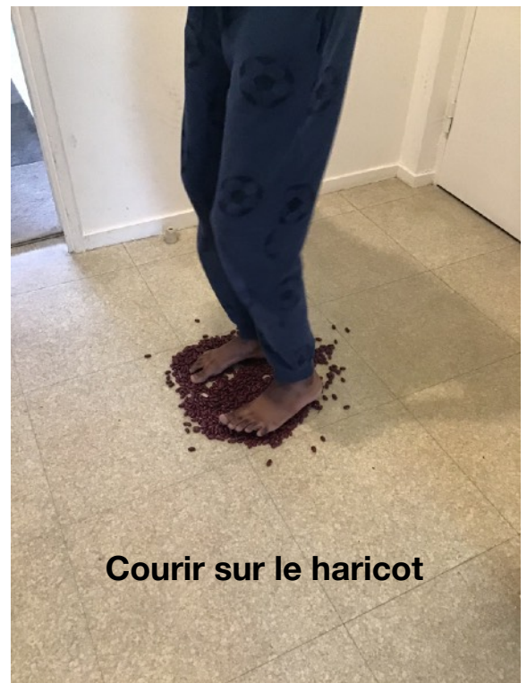
Courir sur le haricot