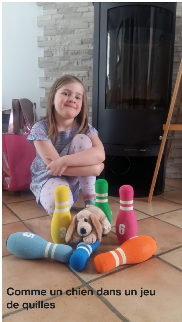
Comme un chien dans un jeu de quilles