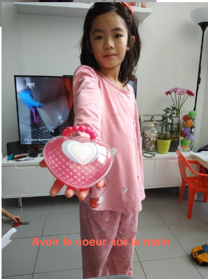
Avoir le coeur sur la main