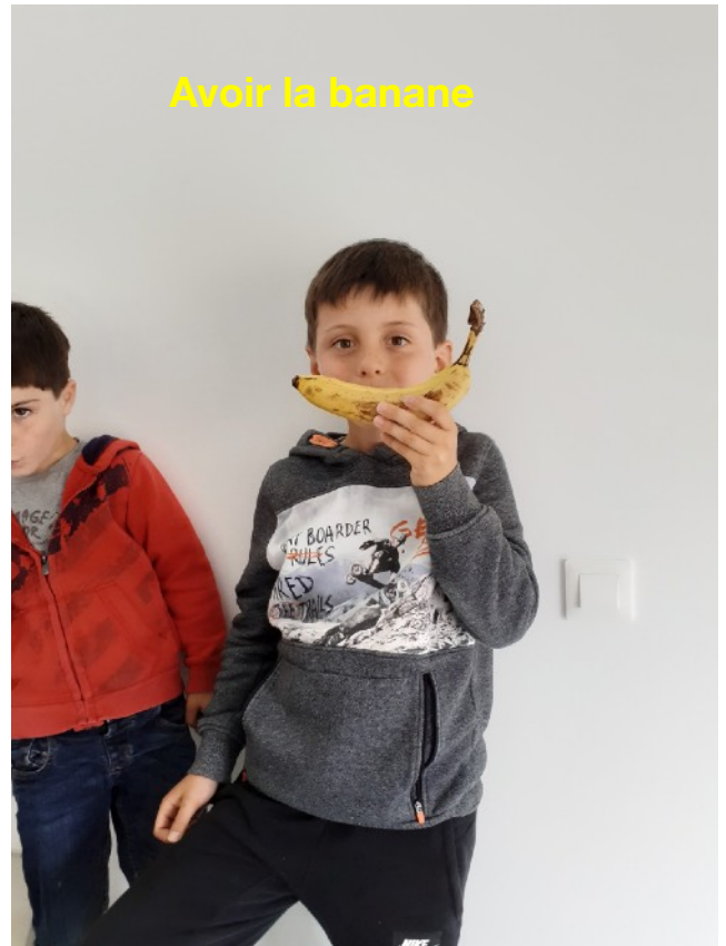
Avoir la banane