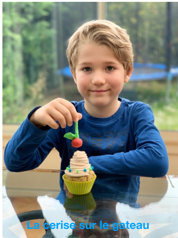
La cerise sur le gateau