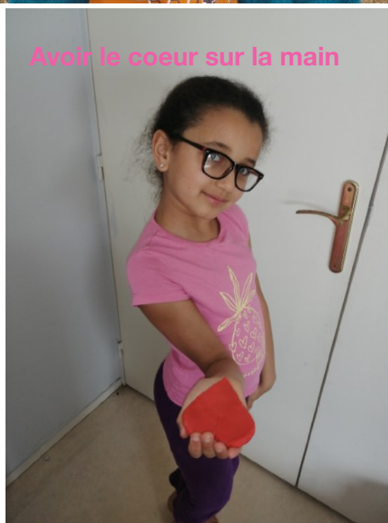
Avoir le coeur sur la main