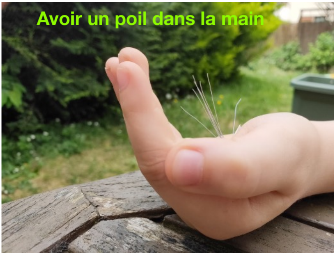
Avoir un poil dans la main