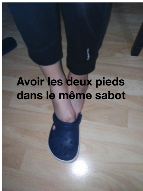
Avoir les deux pieds dans le même sabot