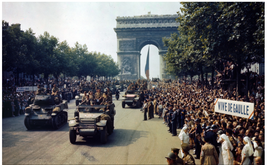
Doc D : photo prise à la libération de Paris en 1944

Petit à petit la Résistance grandit et s'organisa. Les Français acceptaient de moins en moins la collaboration. L'unité de la Résistance se fit autour du général De Gaulle. Par des attentats et des actes de sabotages, la Résistance prépara la libération du pays.