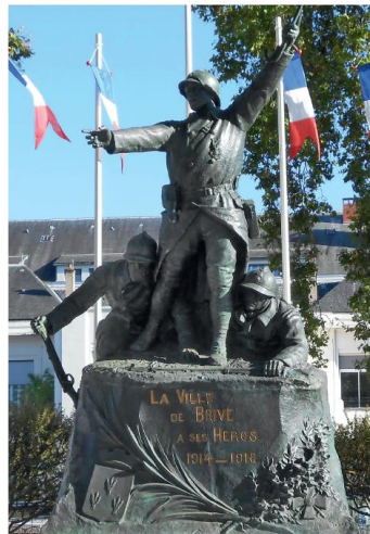
c. À Brive-la-Gaillarde (Corrèze) : « À ses héros ».