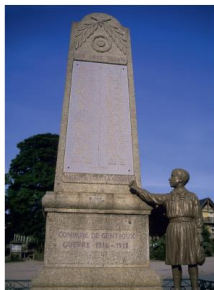
b. À Gentioux (Creuse) : « Maudite soit la guerre ».