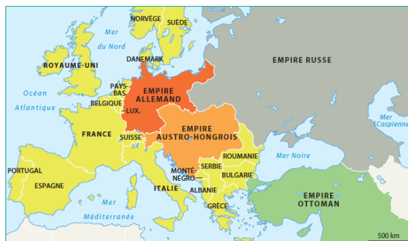
L'Europe en 1914