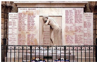
a. Crépy-en-Valois (Oise) : « À ses enfants morts pour la France ».