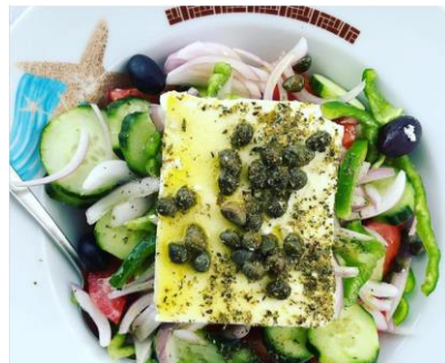
La salade grecque avec la fêta