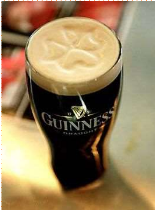
La bière Guinness

IRISH STEW : Ragout d'agneau mijoté avec des pommes de terre et des carottes !