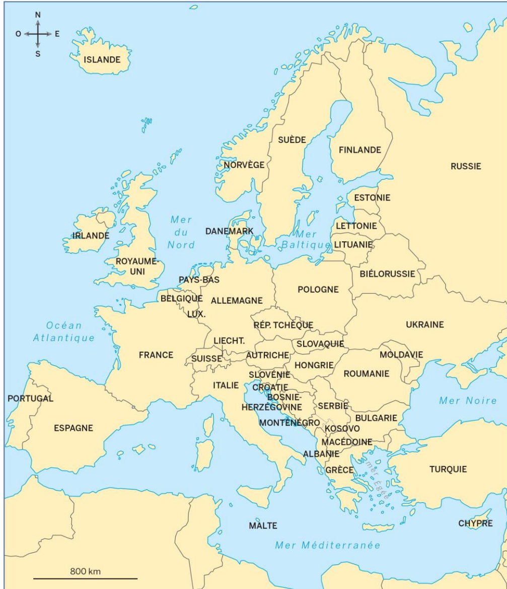
Les pays d'Europe

Situer le pays en Europe , écrire sa capitale et dessiner le drapeau.