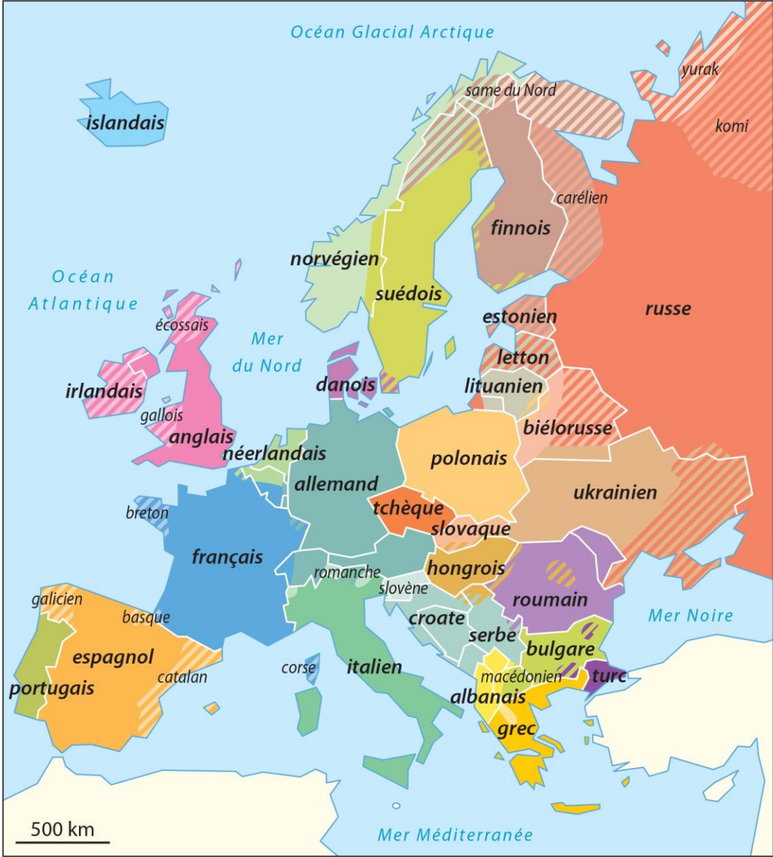
Les langues parlées en Europe

Ecrire le nom de ses habitants et celui de la langue parlée Inclure un audio si possible pour écouter la sonorité de la langue.