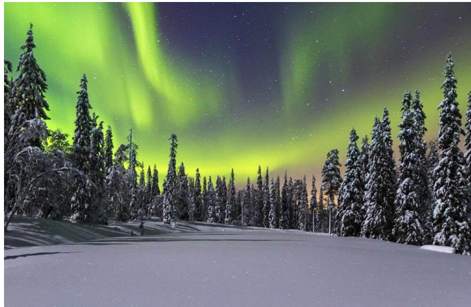
Une aurore boréale