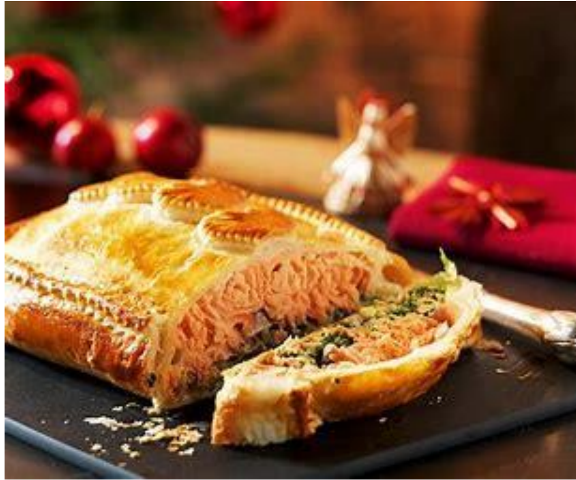
Saumon en croûte