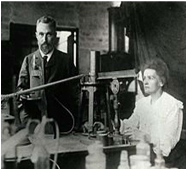
Pierre et Marie Curie dans leur laboratoire de fortune de l'École municipale de physique et de chimie industrielles , vers 1906.

Elle a découvert et développé son savoir grâce à son père qui était professeur de physique et en classe il montrait des expériences.