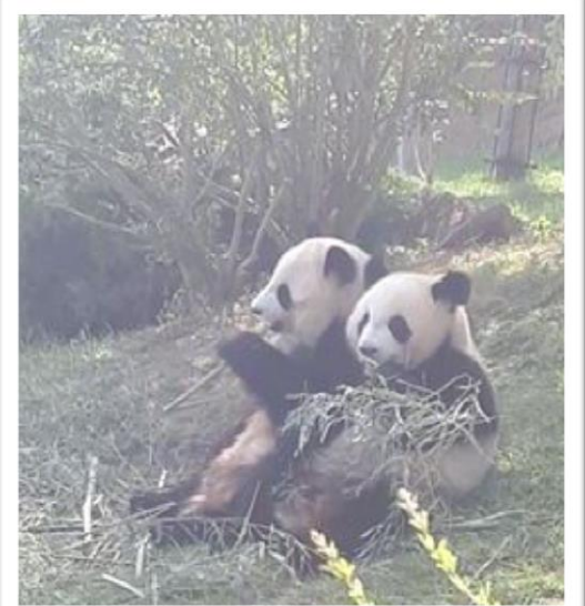
Yuan Meng et sa maman Huan Huan au Parc de Beauval été 2019,

Photo prise lors d'un formidable séjour en famille