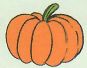
une citrou ille

Les noms féminins terminés par les sons « -ail, -eil, euil, ouil » se terminent par -ille .