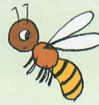
une abe ille