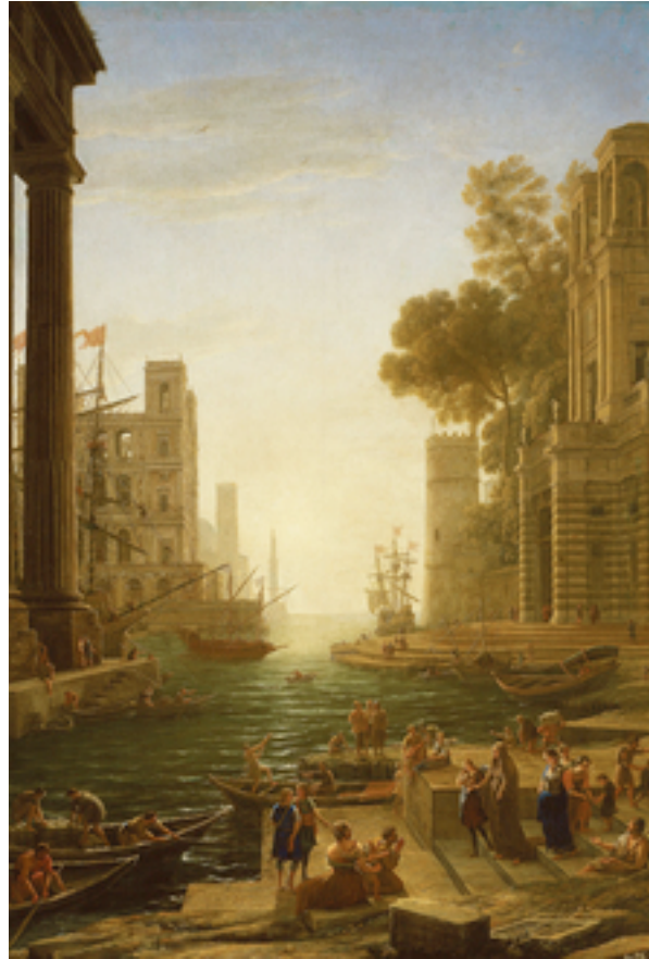
Claude Le Lorrain (1600-1682), Embarquement de Sainte Paule à Ostie, le port de Rome, 1637-1639, Madrid, Musée du Prado.