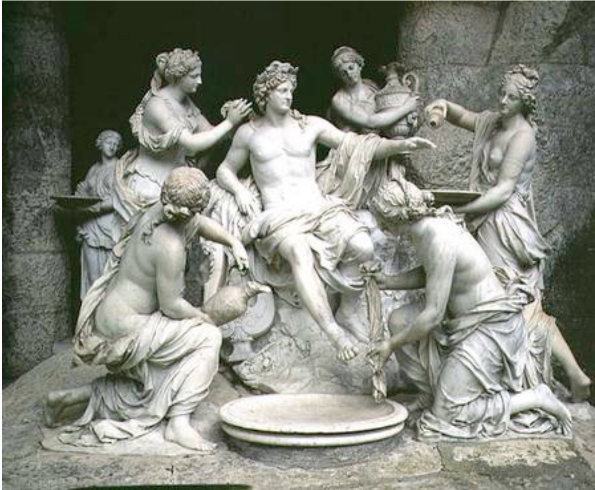
François Girardon (1628-1715), Apollon servi par les nymphes , 1670, Jardins du château de Versailles.