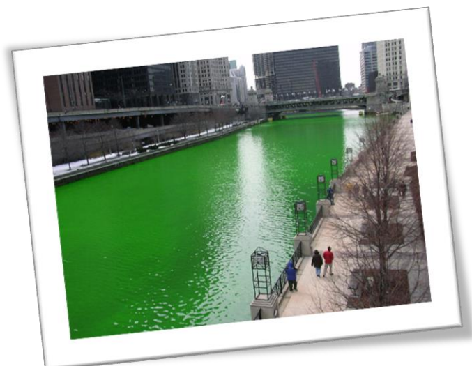
La « Chicago River » est teinte en vert tous les ans à l'occasion de la Saint-Patrick.