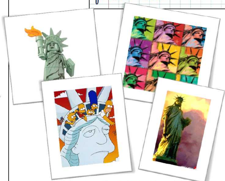
La statue de la liberté est souvent réutilisée dans l'art, la publicité, le cinéma...