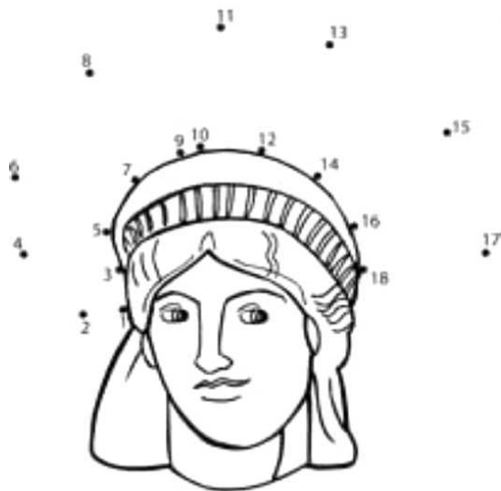
The Statue of Liberty