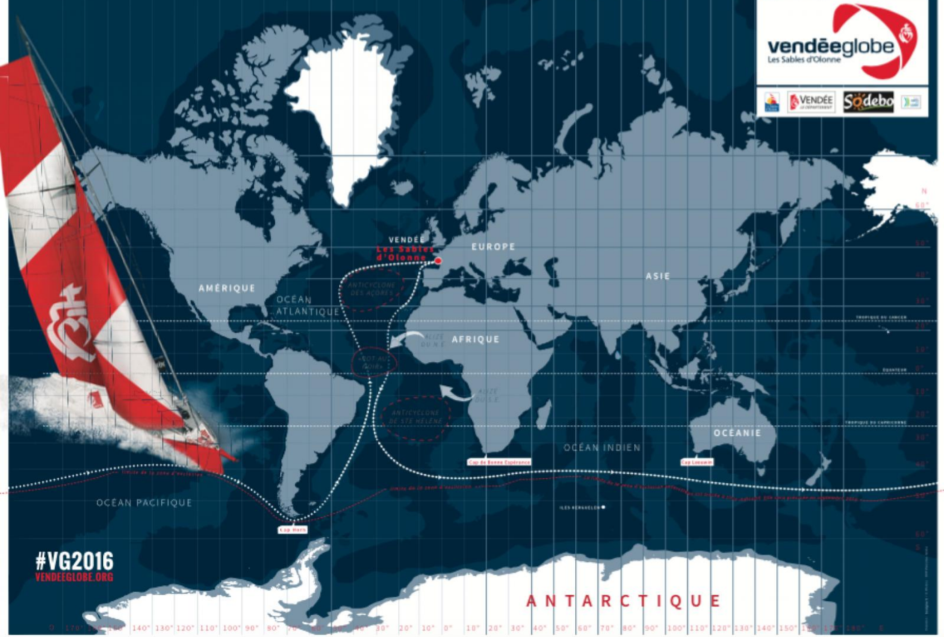
Carte du parcours prévu