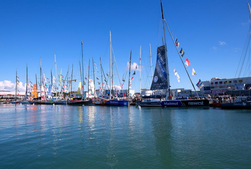
Les bateaux sur le ponton avant le départ