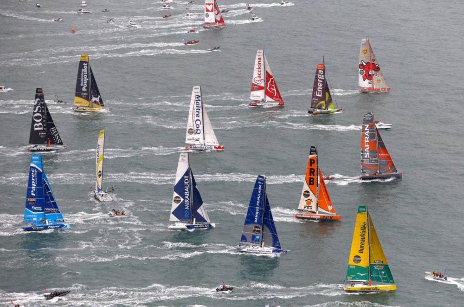
Départ de la course en 2008