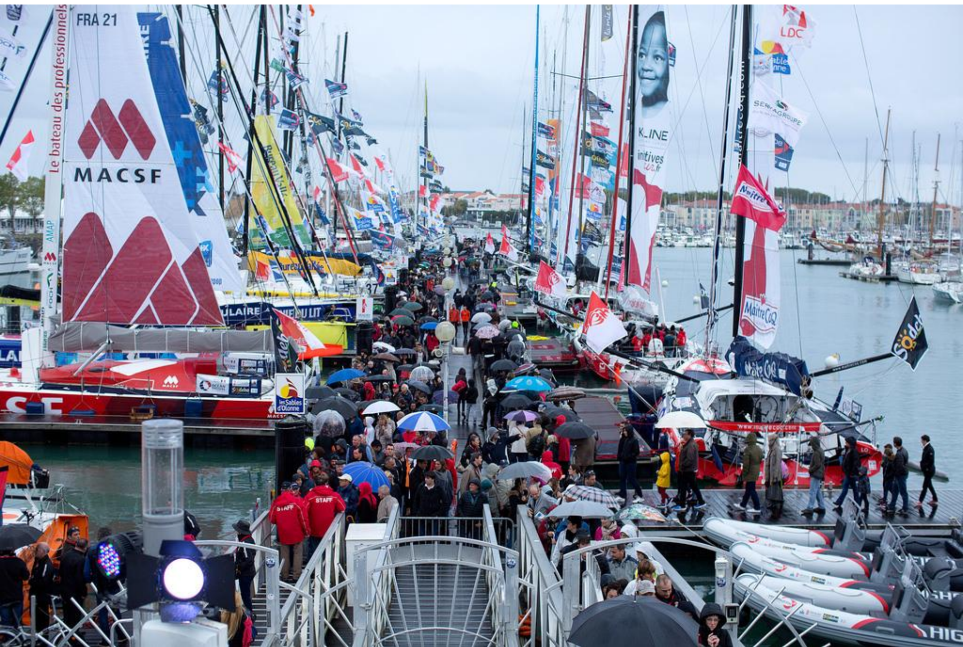
Les Sables d'Olonne - Vendée