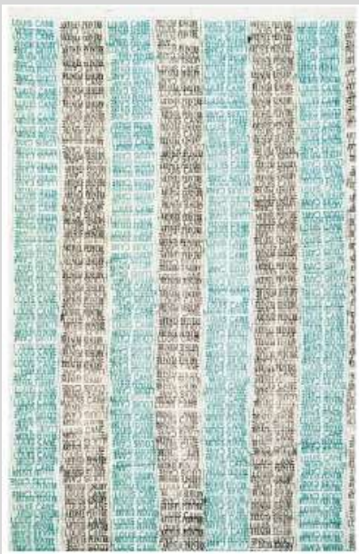
Louis CANE Toile tamponnée 1988