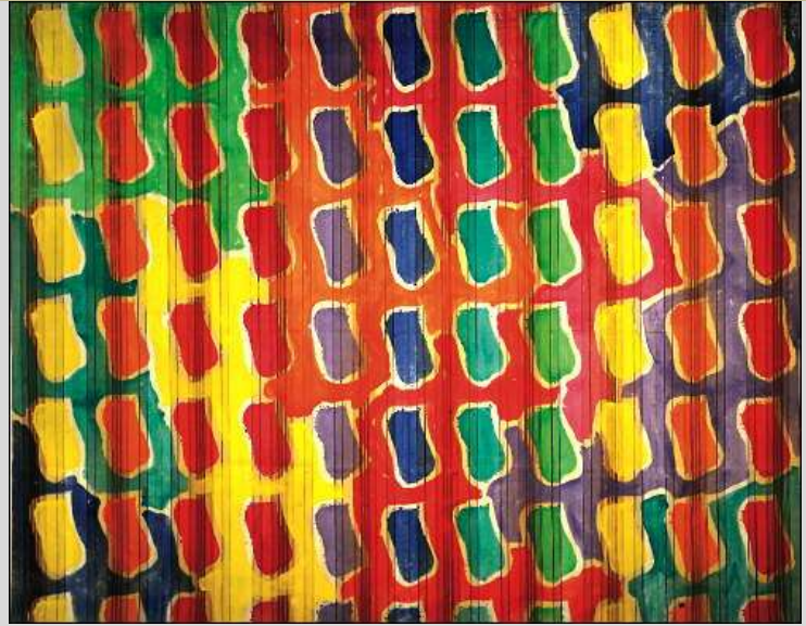
Claude VIALLAT Acrylique sur toile 2001