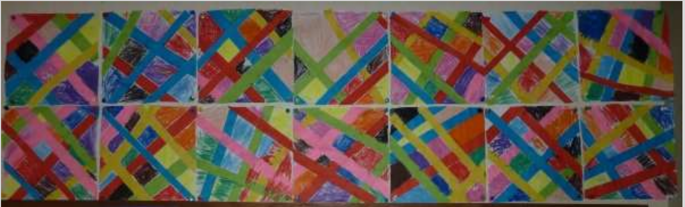
Daniel DEZEUZE Sans Titre 4