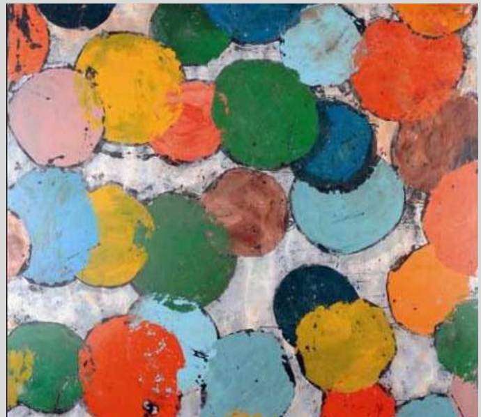
J-Pierre PINCEMIN Sans titre 2003