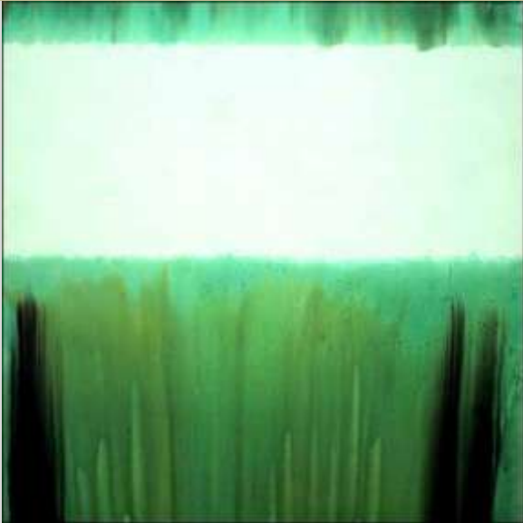
Marc DEVADE Sans titre 1973