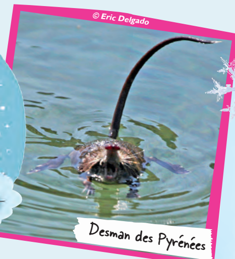
Desman des Pyrénées