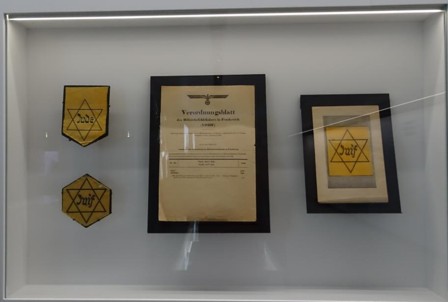
1. Étoile jaune avec la mention « Juif » portée en France, conformément au décret du 17 juillet 1942. Cette étoile a été portée par les Juifs français pendant la Seconde Guerre mondiale.