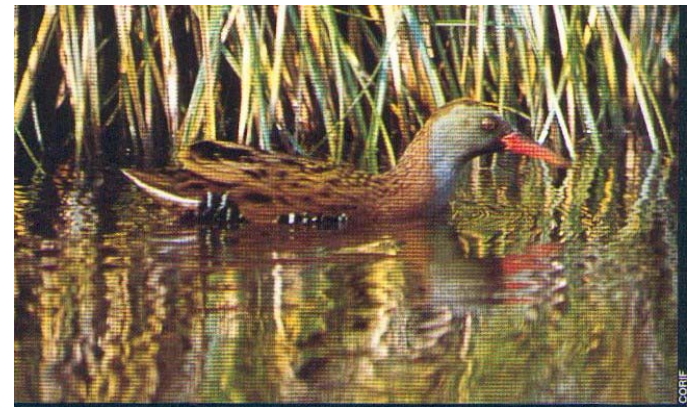
Râle d'eau