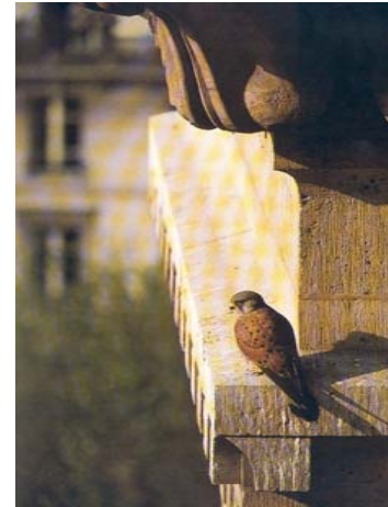
Faucon crécerelle