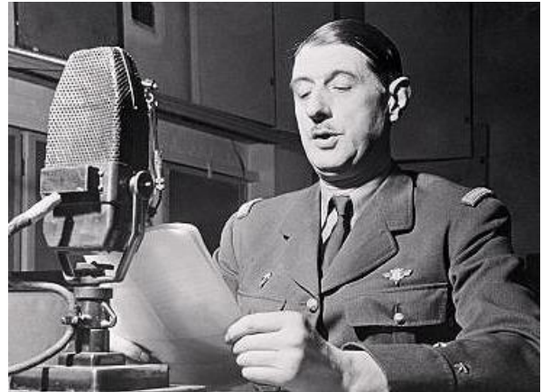
le Général de Gaulle