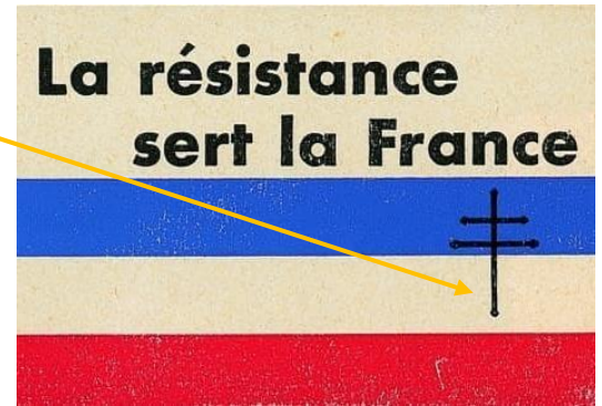
La croix de la Résistance

Mais, certains Français refusent de baisser les bras et décident de résister.