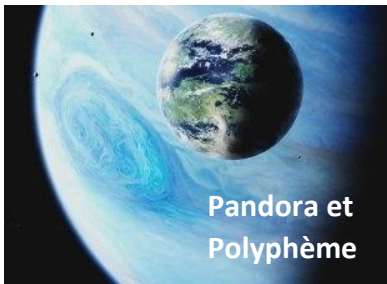
Pandora et Polyphème