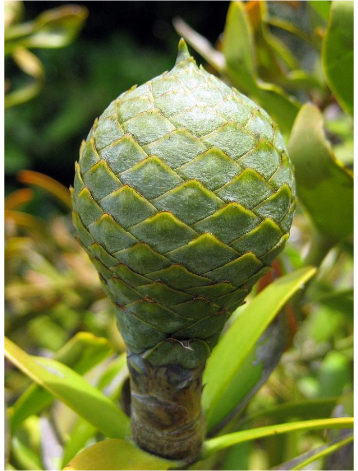
UN KAORI GEANT