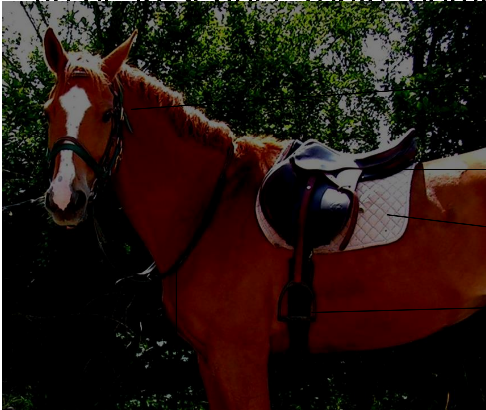
→ Le filet

Les différentes étapes de la préparation sont, d'abord de saluer le cheval, le brossage et après de l'équiper pour le monter, sans oublier la récompense pour le cheval à la fin de la séance (pain, pomme, carotte ...)