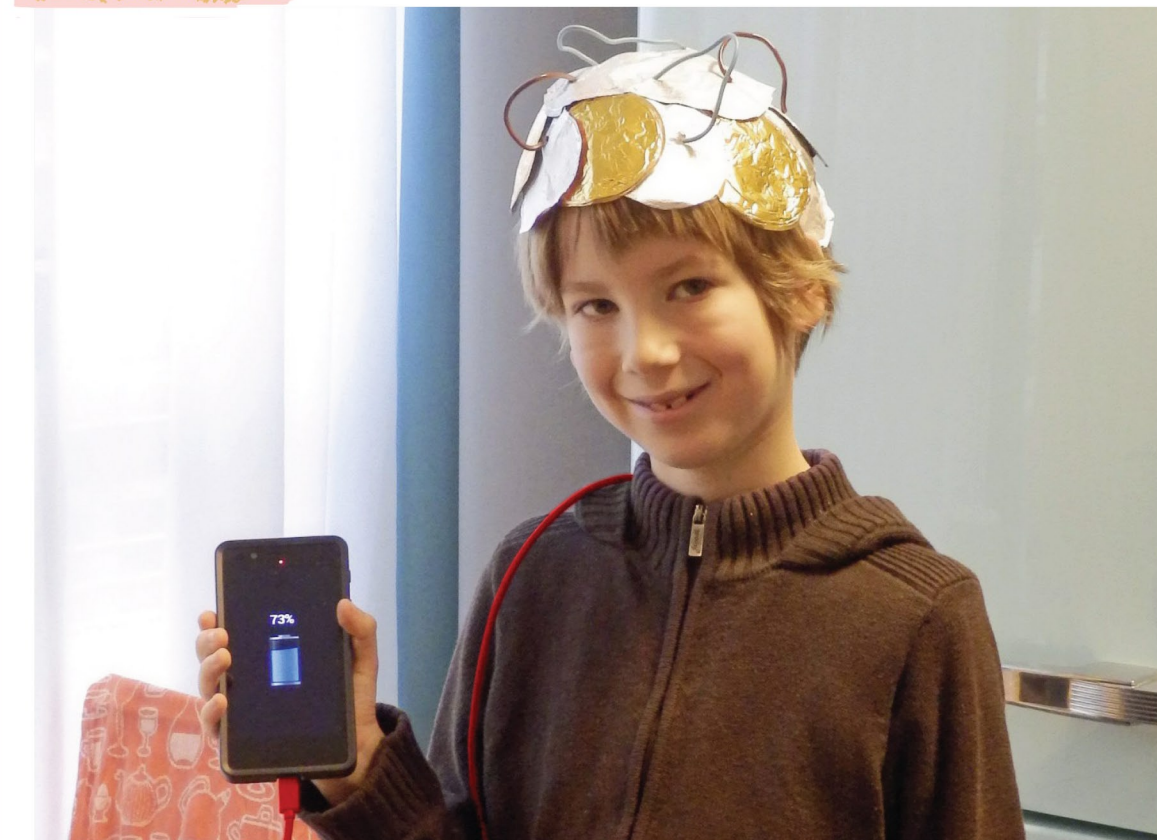
Textes et photo : N. Toréjman. Illustrations : Gaëlle Duhaizé

Valentin a inventé un système très écologique pour économiser de l'énergie et éviter de polluer.