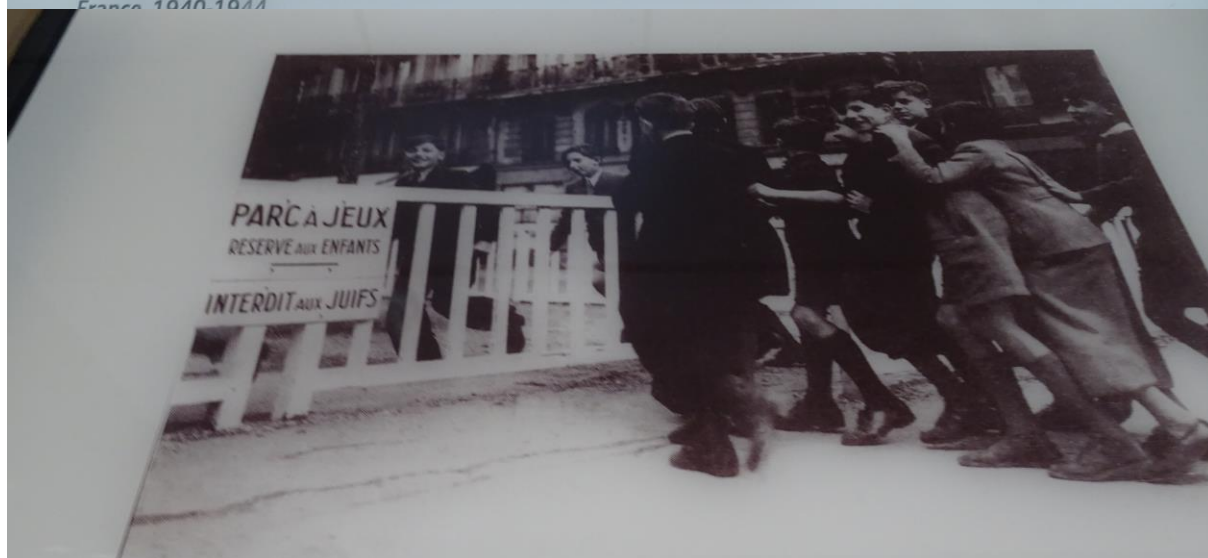
↑ Panneau « Interdit aux Juifs » à l'entrée d'un parc, Paris, 1942 SIGN READING "NO JEWS" AT THE ENTRANCE TO A PARK, PARIS, 1942 À partir de juillet 1942, la plupart des lieux publics sont interdits aux Juifs.