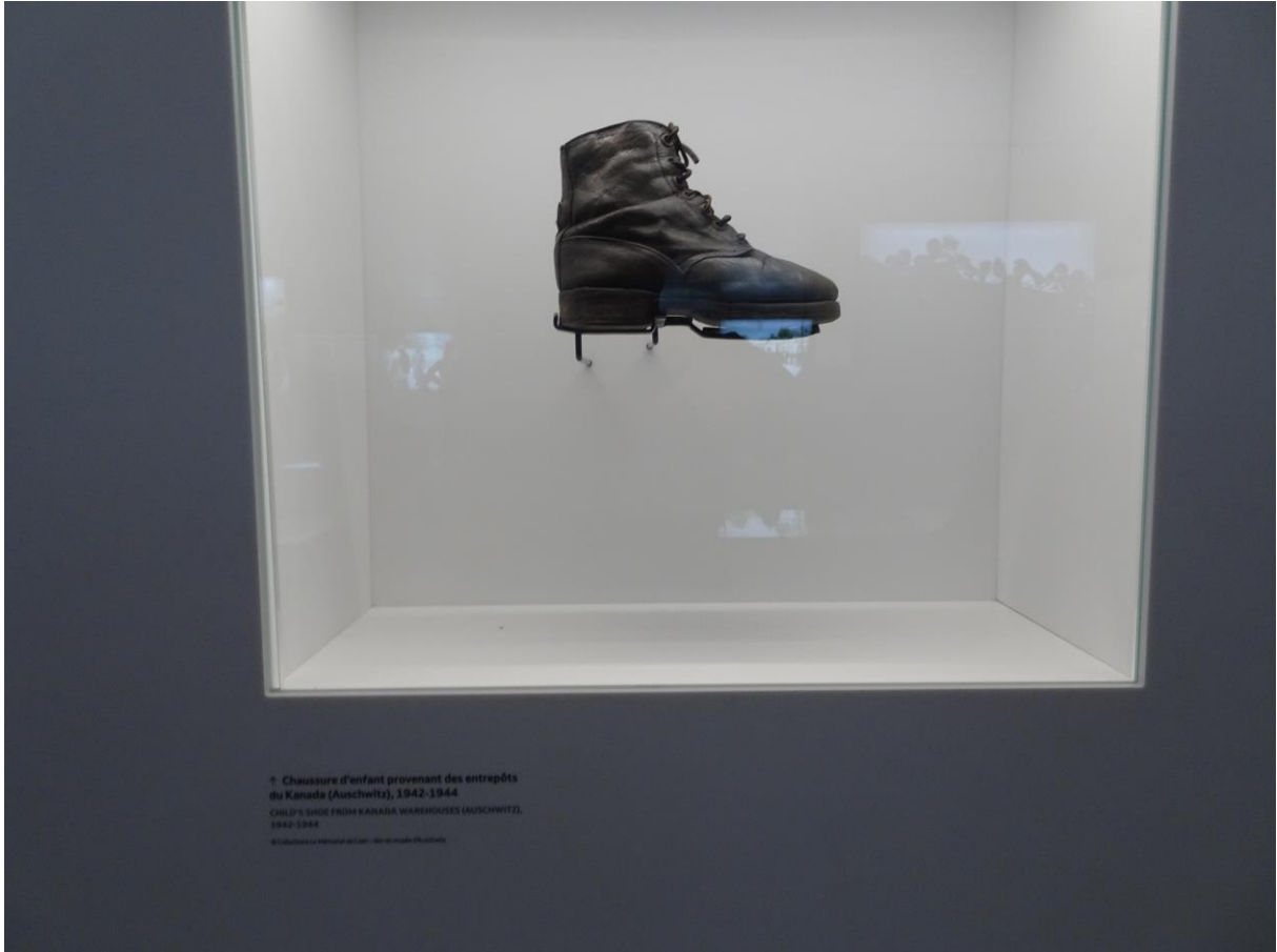
1 Chaussure d'enfant provenant des entrepôts du Kanada (Auschwitz), 1942-1944 CHILD'S SHOE FROM KANADA WAREHOUSE (AUSCHWITZ), 1942-1944