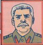
URSS Joseph Staline État totalitaire. Neutre.