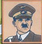
Allemagne Adolf Hitler État totalitaire. Partisan de la guerre.