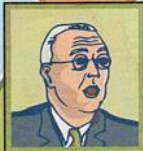
États-Unis Franklin D. Roosevelt République. Neutre.