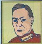
Royaume-Uni George VI Monarchie. Partisan de la paix.