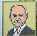
France Albert Lebrun République. Partisan de la paix.