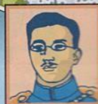
Japon Hirohito Empire totalitaire. Partisan de la guerre.

Totalitaire : qui n'accepte aucune opposition et terrorise la population. Monarchie : pays dirigé par un roi. République : pays dirigé par un président élu.