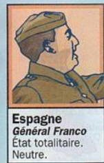
Espagne Général Franco État totalitaire. Neutre.