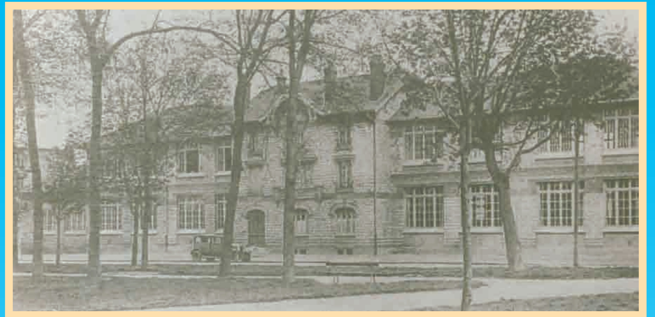
L'école de garçons de Saint Gratien (1934).

21 juillet 1912 : l'école de garçons de Saint Gratien est inaugurée en présence du Maire de l'époque, Charles Grusse-Dagneaux. Elle comporte 5 classes installées dans les ailes et les logements des maîtres dans le corps central du bâtiment.