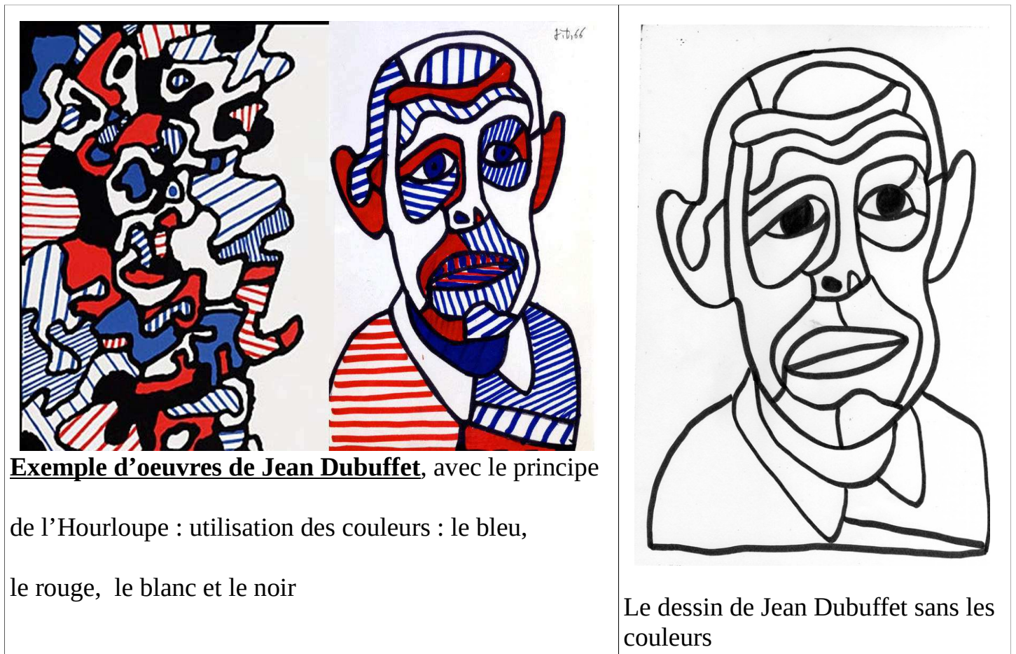
Exemple d'œuvres de Jean Dubuffet, avec le principe

- Laisser ces zones assez larges pour pouvoir y placer ses couleurs : aplats ou lignes