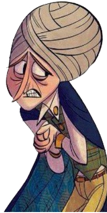
Le professeur Quirell