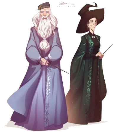
Dumbledore et MacGonagall