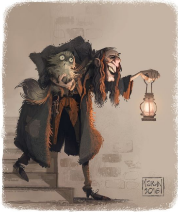
Rusard et sa chatte Miss Teigne