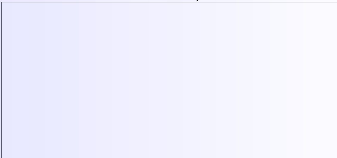
Schéma de l'expérience

Aide : Utiliser les mots : tube à essais, pipette, prélever, solution