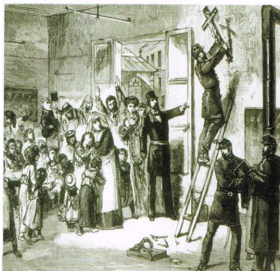
En 1881-1882, les lois Jules Ferry imposent la laïcité dans les écoles publiques.

Art. 9 : À l'école, personne n'a le droit de t'insulter ou de te faire violence, personne n'a le droit d'être exclu à cause de sa religion , de son sexe ou de la couleur de sa peau.