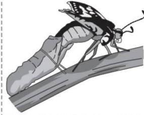
La chrysalide (nymphe)