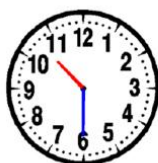
Il est 10 h 30 min. (10 h et demie) La petite aiguille est à mi-chemin entre le 10 et le 11.