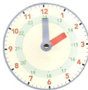
Matin : 2 h 00 min. Après-midi : 14 h 00 min.

1 jour = 24 heures 1 heure = 60 minutes 1 minute = 60 secondes