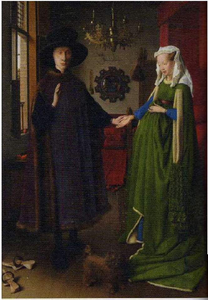
▲ Jan van Eyck, Les Époux Arnolfini , 1434, huile sur toile, 82 x 60 cm (National Gallery, Londres).

Arnolfini est un marchand italien, installé à Bruges vers 1421. Il vend des produits de l'artisanat local (tapisseries, chapeaux) ou de commerce lointain (soie, laine). Il devient le banquier et le conseiller du duc de Bourgogne.