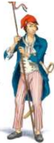
Doc 3 Un sans-culotte

déchiré entre les défenseurs de la monarchie et les révolutionnaires qui veulent faire tomber la royauté. La Première République est proclamée le 22 septembre 1792.