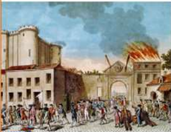
Doc 4 La révolte du peuple de Paris lors de la prise de la Bastille le 14 juillet 1789