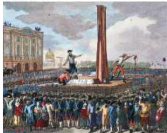
Doc 5 L'exécution du roi Louis XVI