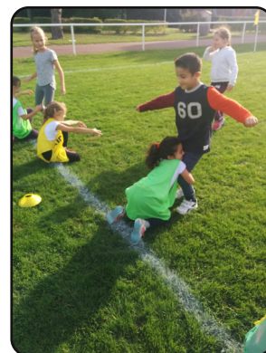
Entraînement au plaquage