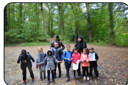
..... la bonne humeur !