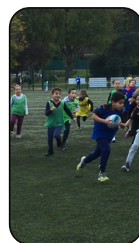
Match du tournoi

Nous avons appris au musée du rugby que les premiers ballons de rugby étaient en cuir.