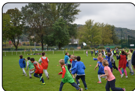
Nos premiers matchs

A la première séance, nous avons appris à faire les passes. A la deuxième séance, nous avons appris à faire des plaquages et à la troisième, nous avons appris à jouer des matches.