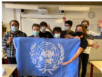
Le staff des organisateurs

Une dizaine d'élèves a participé du 22 au 26 janvier au Parlement Européen des Jeunes. La session du PEJ a été préparé en amont par 7 de nos élèves, membres du MUN, afin d'accueillir le Parlement Européen au lycée Albert Camus. L'ensemble des débats, jeux, ateliers, team building a eu lieu en visio conférence, entre des jeunes venus de 8 pays différents. Les débats portaient sur « Les Nouvelles Technologies et leurs enjeux éthiques, économiques et environnementaux.