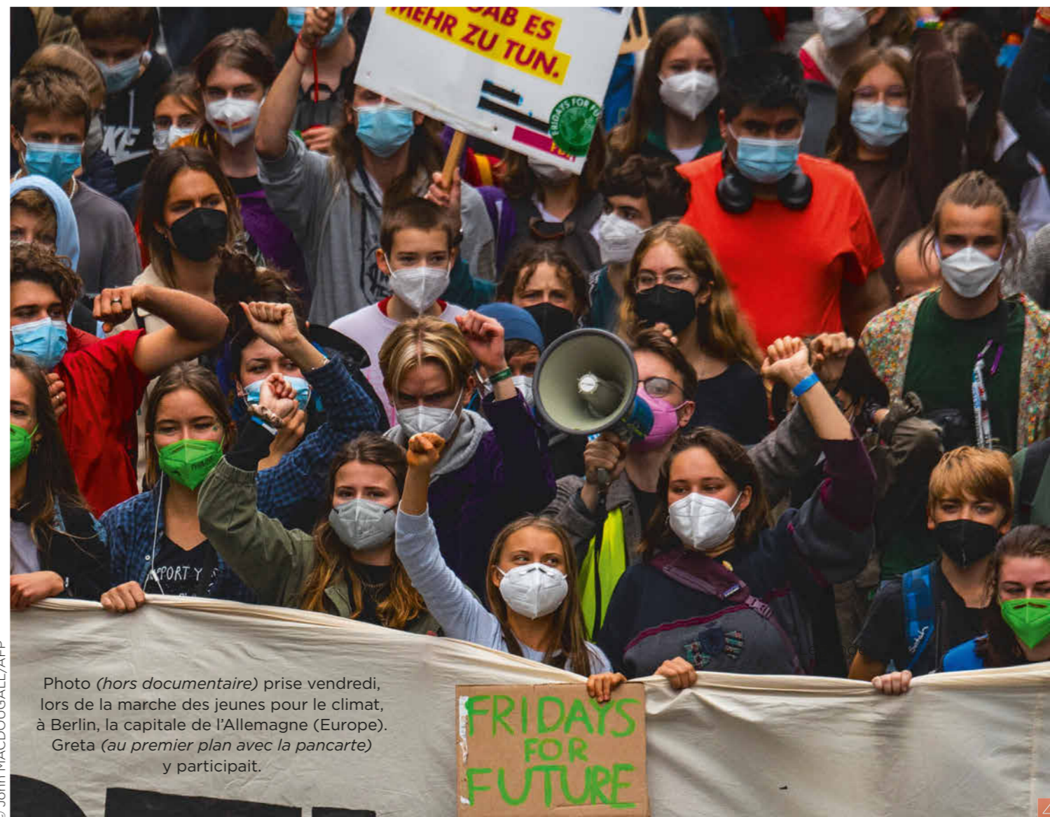
Photo (hors documentaire) prise vendredi, lors de la marche des jeunes pour le climat, à Berlin, la capitale de l'Allemagne (Europe). Greta (au premier plan avec la pancarte) y participait.