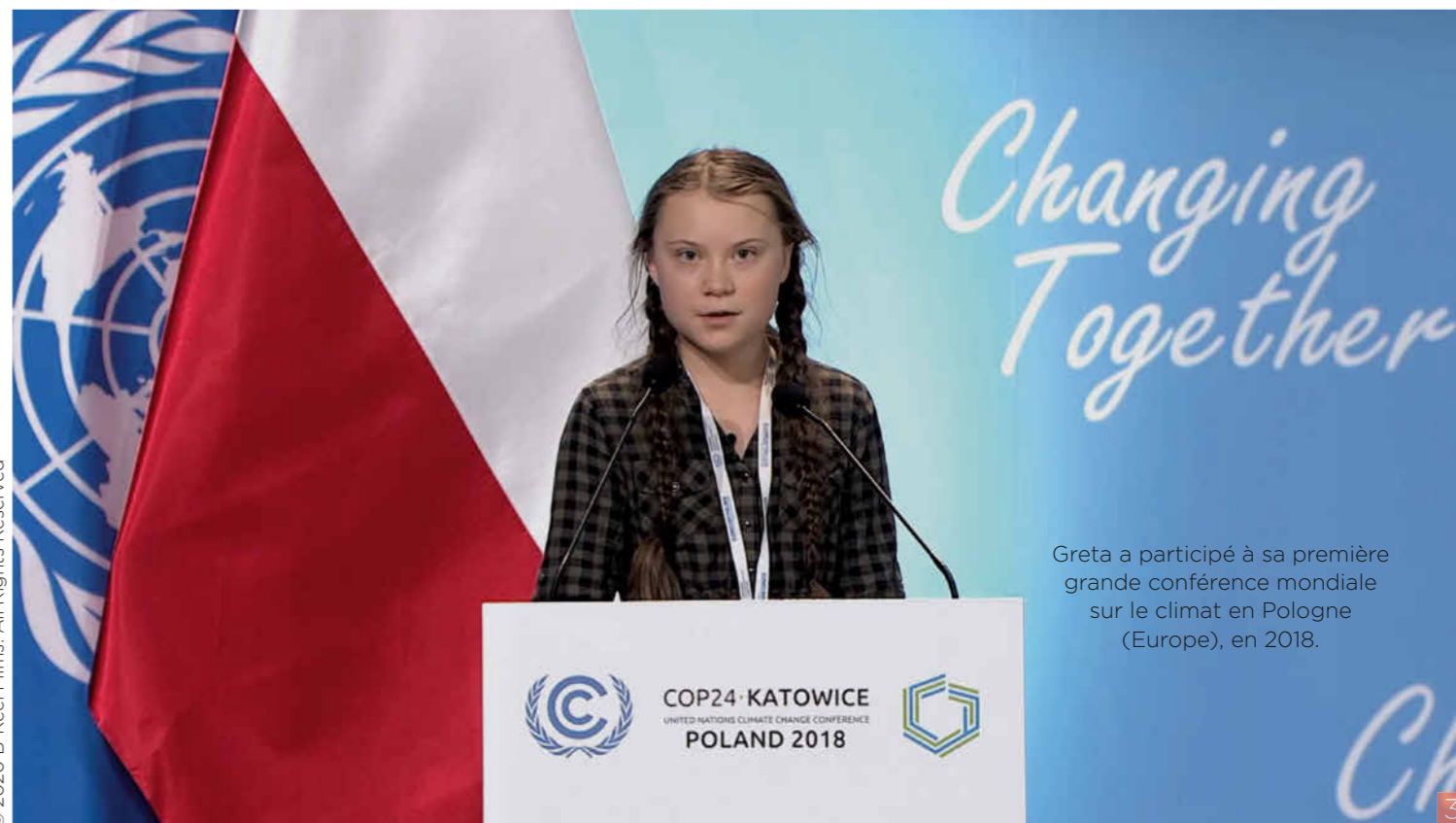
Greta a participé à sa première grande conférence mondiale sur le climat en Pologne (Europe), en 2018.

ONU Organisation des Nations unies, défendant la paix dans le monde. Théorie du complot Manière différente (et fautive) d'expliquer certains faits.