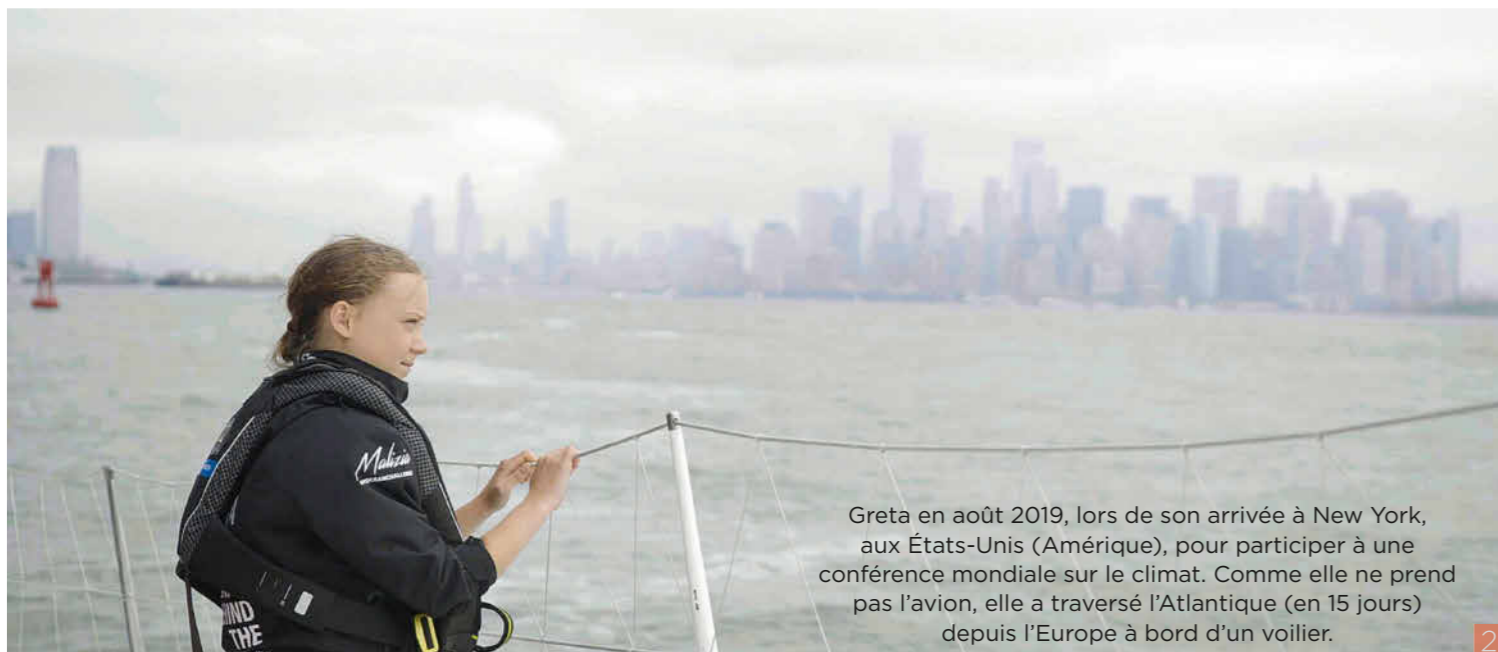
Greta en août 2019, lors de son arrivée à New York, aux États-Unis (Amérique), pour participer à une conférence mondiale sur le climat. Comme elle ne prend pas l'avion, elle a traversé l'Atlantique (en 15 jours) depuis l'Europe à bord d'un voilier.