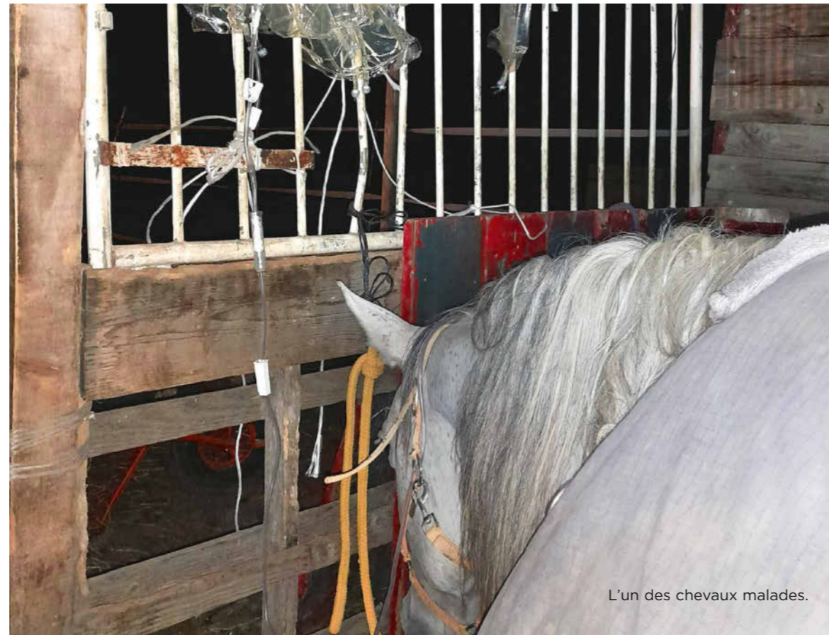
L'un des chevaux malades.

Il n'existe pas de remède contre cette plante. « On a appelé jusqu'en Amérique pour avoir des informations, a expliqué l'éleveuse. Personne ne sait rien... » Des experts ont conseillé aux centres équestres de la région de vérifier leur foin avant de le donner aux animaux. Selon eux, l'adonis est mortelle dans 8 cas sur 10.