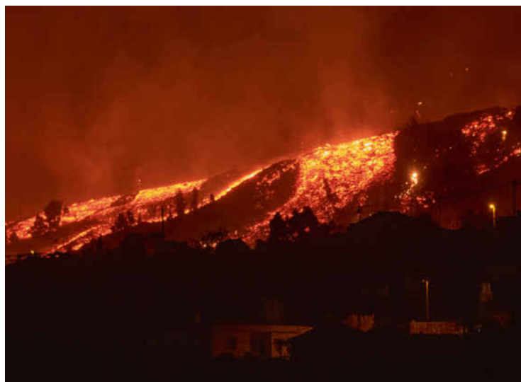
La lave coulant sur les pentes du Cumbre Vieja, dimanche. Avant 1971, ce volcan était aussi entré en éruption en 1949.

Les experts s'attendaient à cette éruption car, la semaine dernière, plusieurs tremblements de terre avaient secoué l'île. Les Canaries sont un archipel (très touristique) d'origine volcanique. La dernière éruption sur ces îles datait de 2011. S. H.